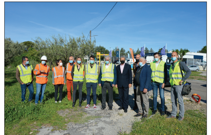
Le chantier se fait en co-maîtrise d'ouvrage entre la Ville, le Gard et le Smeg.