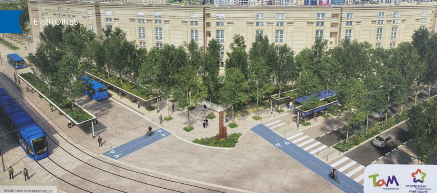
Esquisse de la place de l'Europe (Montpellier) à l'horizon 2025