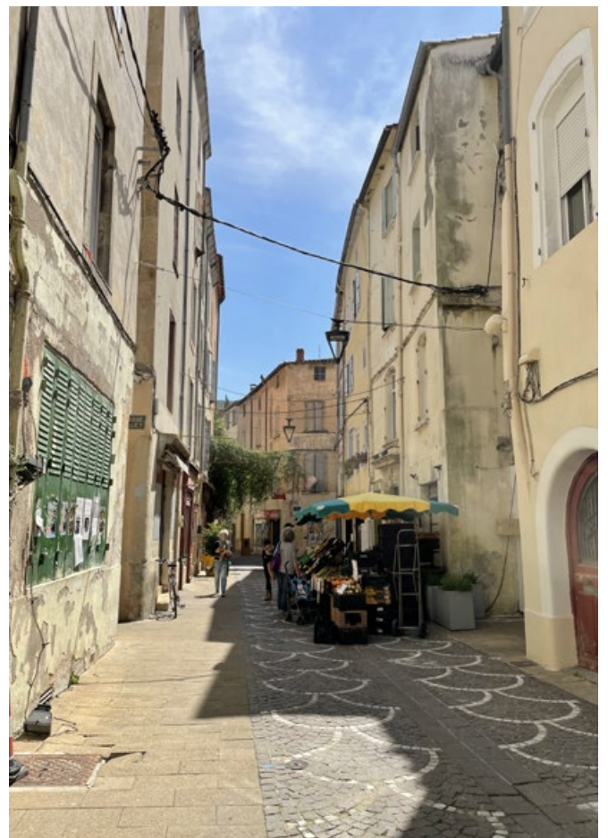
Rue commerçante