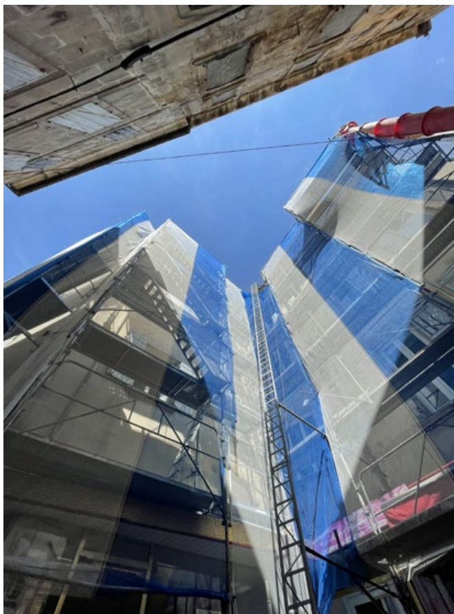
Travaux de façade

but de les réhabiliter. À Lodève, l'un de nos soucis est que de nombreuses cellules commerciales ne répondent plus aux conditions de sécurité et d'accessibilité. Elles exigent des travaux que les propriétaires ne veulent pas ou ne peuvent pas couvrir. La conséquence est qu'ils ne parviennent pas à louer ou à vendre ces espaces. Pour redynamiser l'aspect commercial de la ville, nous avons un partenariat avec l'Agence nationale pour la Cohésion des Territoires (ANCT), ainsi qu'un partenariat avec la Région Occitanie depuis un an. Cette dernière a lancé FOCCAL, un outil régional de soutien au commerce et à l'artisanat qui aide les territoires à acheter, rénover et réhabiliter les commerces. Ces 2 partenaires nous permettent de réaliser les travaux avant d'accueillir de nouvelles activités. Pour sélectionner les commerçants qui vont bénéficier de ces espaces réhabilités, nous avons lancé 2 études, une sur l'existant, l'autre sur les besoins des habitants. C'est à partir de ces données que nous allons sélectionner les projets. »