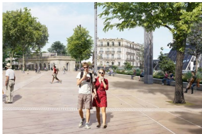
Esquisse de la future place de la Comédie © Métropole de Montpellier

C'est pourquoi le tunnel de la Comédie sera fermé à compter du 27 juin (coupant ainsi la 113), en même temps