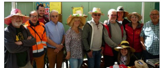
L'équipe du comité des fêtes et loisirs sur le stand de la restauration.

C'est toute la journée du dimanche 8 mai que s'est tenu sur la promenade de la Digue le deuxième marché aux fleurs organisé par le comité des fêtes et des loisirs de Nyons qui tenait pour l'occasion un petit stand buvette restauration positionné devant le théâtre de verdure. Une météo capricieuse en tout début de journée n'a finalement pas empêché le bon déroulement de cette manifestation qui a au final ravi tous les participants, marchands compris.