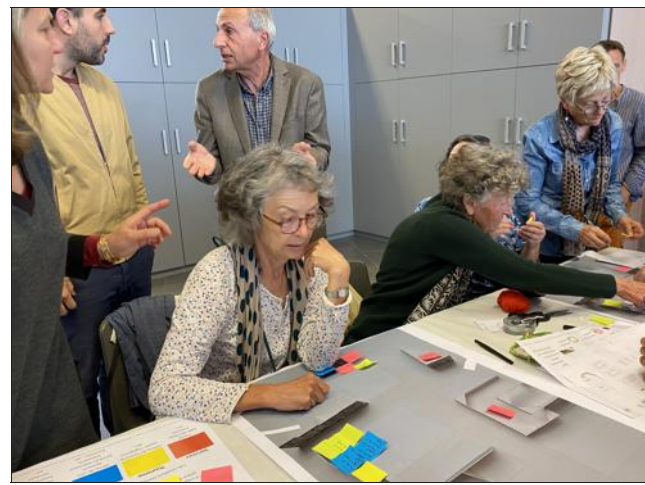
Des débats animés où chacun a tenté d'exprimer ses vœux d'aménagement ou ses préoccupations quant au cœur du village.